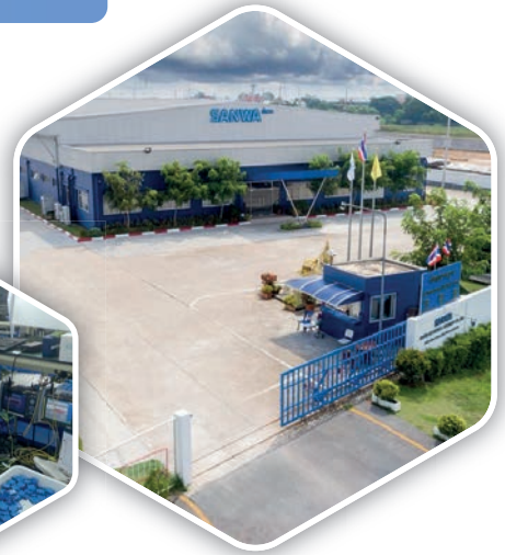
三和テクノロジーズ 八王子工場